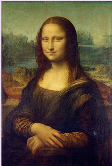
Mona Lisa, autor Leonardo da Vinci