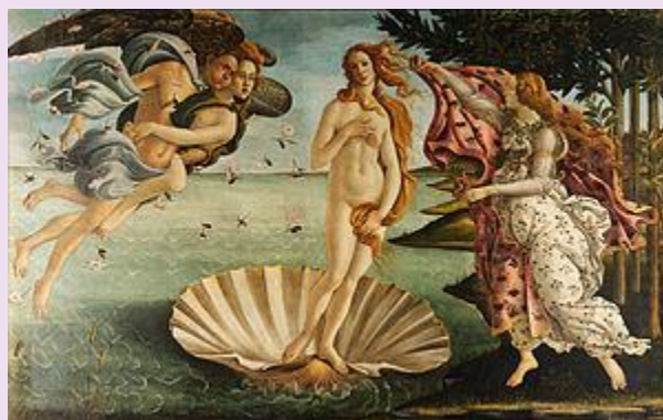
Zrození Venuše, autor Sandro Botticelli