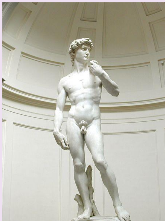
Socha Davida, autor Michalangelo Buonarroti