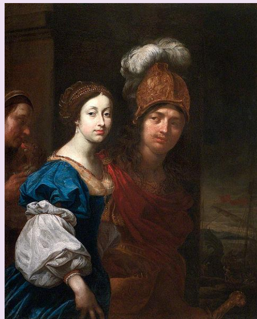
Paris a Helena, autor Karel Škréta