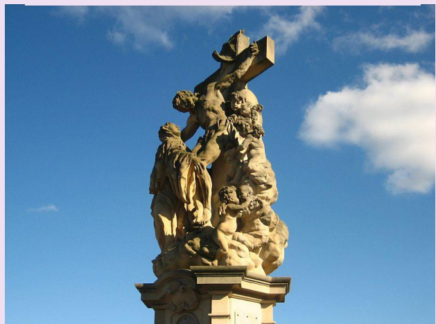
Sousoší Sen sv. Luitgardy na Karlově mostě v Praze, autor Matyáš Bernard Braun