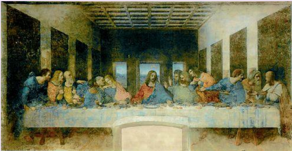
Poslední večeře, autor Leonardo da Vinci