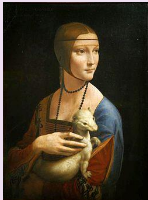
Dáma s hranostajem, autor Leonardo da Vinci