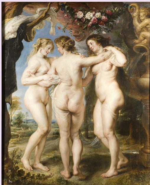
Tři grácie, autor Petr Pavel Rubens